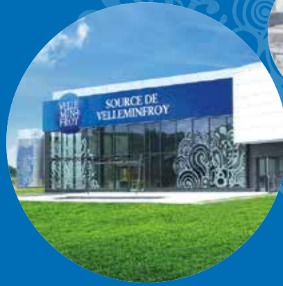
“L'Espace Renaissance,, beherbergt Showroom und Abfüllanlage